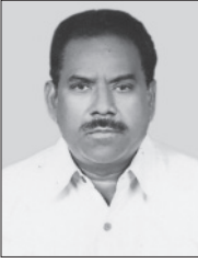
శ్రీ కొత్త రాధాకృష్ణమూర్తి