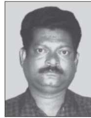
శ్రీ వై.యస్.ఆర్. (కోల్)