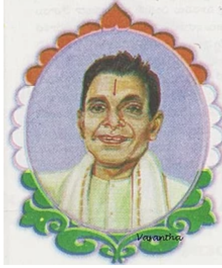
పింగళి వెంకయ్య విగ్రహం