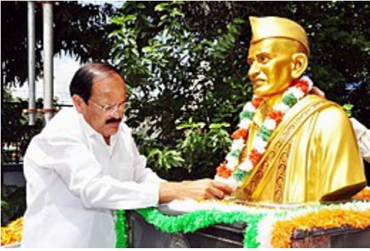
వెంకయ్య విగ్రహానికి పూలమాల వేస్తున్న వెంకయ్యనాయుడు

ఒక జాతికీ, ఆ జాతి నిర్వహించే ఉద్యమానికీ ఒక పతాకం అవసరమన్న గొప్ప వాస్తవం వెంకయ్యకు 1906లోనే కలిగిందని అనవచ్చు. కారణం కలకత్తా కాంగ్రెస్ సభలు. 1916 నుంచి 1921 వరకు ఎంతో పరిశోధన చేశారు. 30 దేశాల పతాకాలను అతను సేకరించాడు. 1918 సంవత్సరం మొదలు, 1921 వరకు జరిగిన కాంగ్రెస్ సమావేశాలలో వెంకయ్య జెండా ప్రస్తావన తీసుకువస్తూనే ఉన్నారు. ఆఖరికి కాకినాడ కాంగ్రెస్ సమావేశాలు జరుగుతున్నప్పుడు (1921 మార్చి 31) తొలిసారి అతని ఆశ నెరవేరింది. అంతకు ముందు కలకత్తా సమావేశాల సందర్భంగా ఒక పతాకం తయారయింది. దానిని ఆ నగరంలో బగాన్ పార్క్ పార్కు దగ్గర ఎగురవేశారు. అందుకే దానిని కలకత్తా జెండా అనేవారు. మేడమ్ బైకాజీ కామా, అనిబీసెంట్, సిస్టర్ నివేదిత భారత దేశానికి ఒక పతాకాన్ని రూపొందించాలని తమ వంతు ప్రయత్నం చేశారు. కానీ ఆ అవకాశం వెంకయ్యకు లభించింది. 1921లో గాంధీజీ బెజవాడ వచ్చినప్పుడు వెంకయ్య కలుసుకున్నాడు.