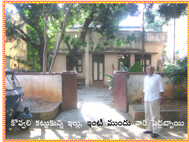
కొవ్వలి కట్టుకున్న ఇల్లు, ఇంటి ముందు వారి పెద్దబ్బాయి

జీవితం మరొక మలుపు తిరిగింది. ఇది మలుపు కాదు. పెద్ద అగడ్త. దాటలేనంత లోతయినదీ, దాటక తప్పనిదీను. పాత మద్రాసులో ఎం.వి.యస్ సంస్థ పుస్తకాలను ప్రచురించేది. ఉద్యమంగా ప్రారంభమయిన రచన ఇప్పుడు ఉపాధి అయింది. అంతే కాదు. పెరిగిన సంసారానికి ఇది బొత్తిగా చాలని ఆదాయమయింది. పుస్తకం రాశాక ప్రచురణకర్త డబ్బు ఇస్తేనే ఇంటికి వెళ్ళాలు వచ్చేవి. అవీ