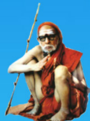
గురు చంద్రశేఖర పరమాచార్య